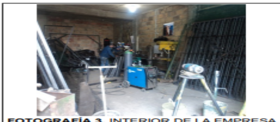
FOTOGRAFÍA 3. INTERIOR DE LA EMPRESA