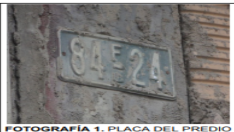
FOTOGRAFÍA 1. PLACA DEL PREDIO