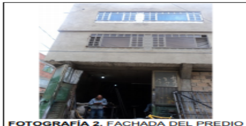
FOTOGRAFÍA 2. FACHADA DEL PREDIO